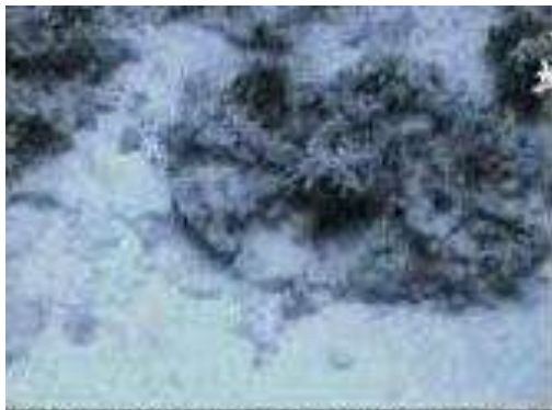
Actual coral covered chariot wheel

Maar.... waarom fascineert mij dit stukje wereld toch zo? Dat heeft onder andere met Google Earth te maken. Deze gratis dienst maakt het mogelijk om bijna iedere plek op aarde te bekijken door erop in te zoomen. Op deze wijze is het nu mogelijk om nog eens te bekijken waar ik zoal geweest ben op m'n reizen. Zo bekeek ik ook maar eens de haven van Akaba. Die blijkt intussen flink uitgebreid te zijn en er liggen nu meerdere schepen. Ook lijkt het erop dat de grens met Saudi Arabië een stuk zuidwaarts verschoven is, zodat Jordanië wat meer ruimte aan de Golf heeft gekregen? Bij het inzoomen op de Golf van Akaba blijken ook foto's aangeklikt te kunnen worden. Tot mijn verbazing ontdekte ik zo een stel onderwaterfoto's waarop duidelijk karrewielen op de zeebodem te zien waren, wel geheel overwoekerd door koraal en zeewier, maar nog duidelijk herkenbaar.