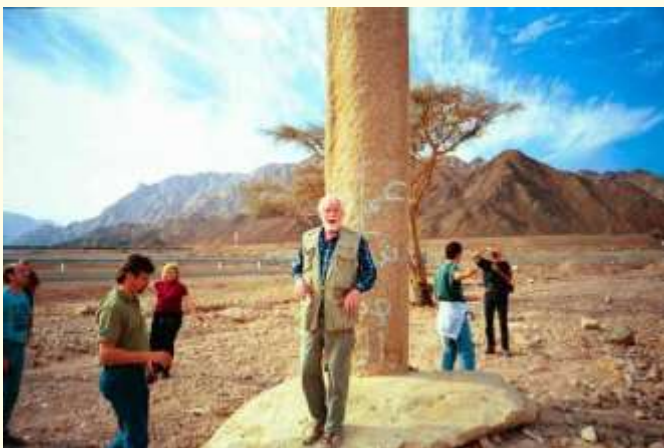
Pilaar bij Nuweiba (Pi Hachiroth)