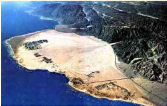
Het strand van Pi Hachiroth, nu Nuweiba

20 En zij kwam tussen het leger der Egyptenaren, en tussen het leger van Israël; en de wolk was te gelijk duisternis en verlichtte den nacht; zodat de een tot den ander niet naderde den gansen nacht.