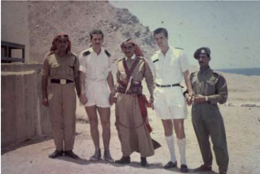
Bij de grens van Jordanië en Saudi-Arabië

keren, de grens werd zwaar bewaakt. Dan maar naar de Saudi Arabische grens, die lag niet ver van ons schip. Tot onze verbazing werden we daar zeer vriendelijk ontvangen door de grenswachters en kregen we mierzoete thee te drinken. Een van de mannen zag eruit als een kameelruiter, alleen z'n kameel was er niet bij.